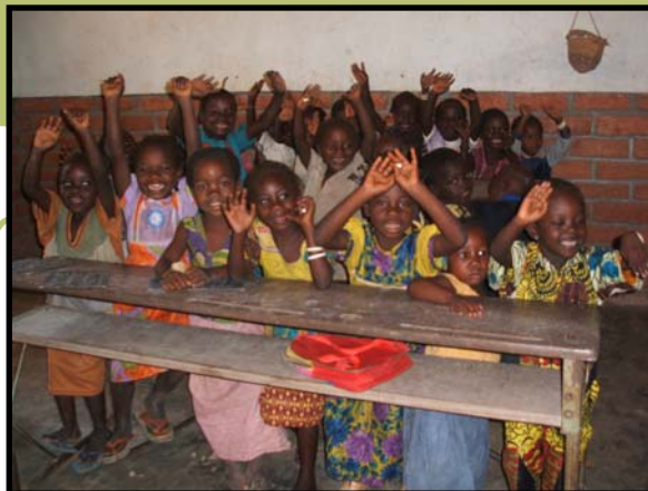
Niños de la escuela infantil de Bakouma