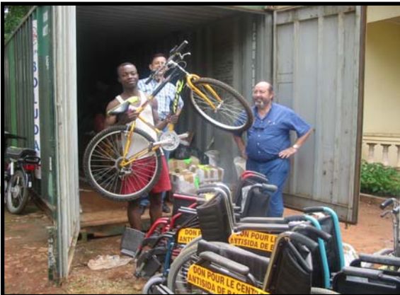
Llegada del contenedor del año pasado a Bangassou

El sábado 18 partió de Córdoba el contenedor lleno con destino a Bangassou. Gracias a vuestras aportaciones y a las de otras personas se han conseguido muchas de las cosas que se pedían. En unos meses llegará a la República Centroafricana, dónde la gente de la Diócesis de Bangassou lo recibirá con una gran alegría.