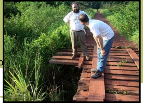
Estado de la pista antes de las obras

“Otra novedad fue que el obispo se fue a Nzacko con el coche en lugar de ir con avión. Esto significa que hemos avanzado mucho en la reparación de la pista que va de Bakouma a Nzacko. Seguimos los trabajos intensivamente para acabar todo durante esta época de calor aquí. Ya hemos hecho muchas cosas: cortar árboles con el hacha, desviar agua, llenar los sitios difíciles, pero queda mucho por hacer. En todo caso, el trabajo es satisfactorio aunque nos esté costando mucho más de lo que habíamos previsto. Ahora, entiendo que no se hace una carretera con 4000 euros. Vamos a seguir adelante hasta el final.” ( Feb. 2006).